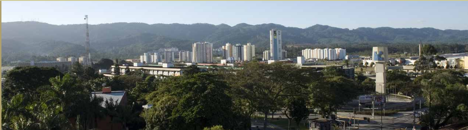
Vista do 6º andar da Andari, Nagib e Marins - Sociedade de Advogados

Andari, Nagib e Marins - Sociedade de Advogados • OAB/SP 7.211 • CNPJ 05.515.803/0001-00 Rua Dr. Ricardo Vilela, 1313, 5º e 6º andares, Centro, Mogi das Cruzes (SP), Brasil Tel: +55 (11) 4796-1194 • 4799-8900 • e-mail: anm@anm-sociedade.adv.br • www.anmjuridico.com.br